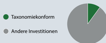
1. Taxonomiekonformität der Investitionen einschließlich Staatsanleihen*