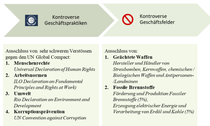
Abbildung: Generelle Ausschlüsse zur Ermittlung des BEKB Anlageuniversums

In einem weiteren Schritt werden im Rahmen einer ESG-Integration Nachhaltigkeitskriterien systematisch in den Anlageprozess eingebunden, um der konventionellen Finanzanalyse eine zusätzliche Dimension zu verleihen. Dabei werden im Rahmen einer ESG Analyse Emittenten auf deren Risiken und Chancen im Bereich Umwelt, Soziales und Governance, deren Management von Klimarisiken sowie deren Verwicklung in kontroverse Geschäftspraktiken analysiert. Als Basis dienen die beiden Kennzahlen "ESG Performance Score" und ein "Carbon Risk Rating", welche durch ISS ESG ( www.issgovernance.com/esg-de ) auf Emittentenebene ermittelt werden.