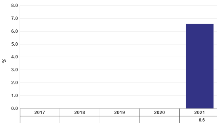
■ AXA WF Global Strategic Bonds A Distribution EUR (ISIN : LU2233203335)

Die Wertentwicklung in der Vergangenheit stellt keinen verlässlichen Hinweis auf zukünftige Ergebnisse dar.